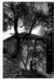
Η Αργολίδα είναι μια από τις πιο δημοφιλείς προορισμούς τουρισμού στην Ελλάδα. Η περιοχή προσφέρει στους επισκέπτες μια ποικιλία από δραστηριότητες, από την επίσκεψη σε αρχαιολογικούς χώρους μέχρι την απολαύση της θάλασσας. Η νομαρχία Αργολίδας οργανώνει το Πανόραμα 2008 με στόχο να προωθήσει τον τουρισμό στην περιοχή.