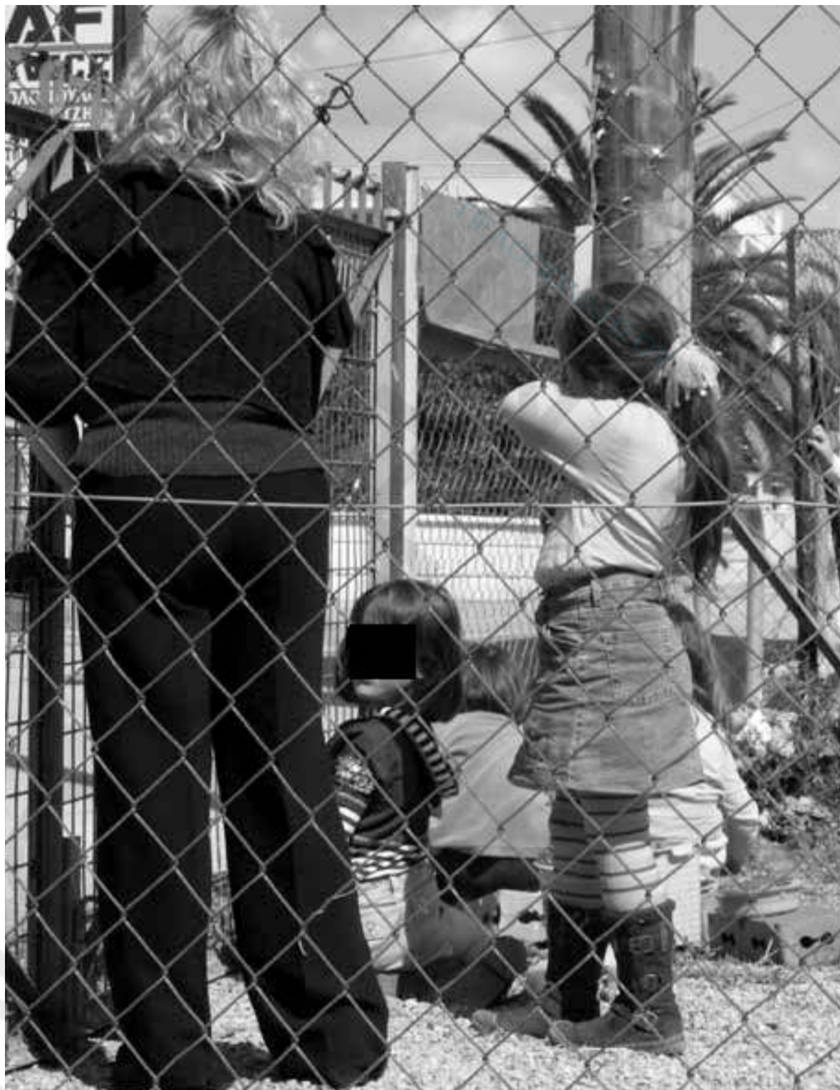
Σε «κοτέτσι» συνεχίζουν να παίζουν τα παιδιά του 9ου Νηπιαγωγείου Άργους