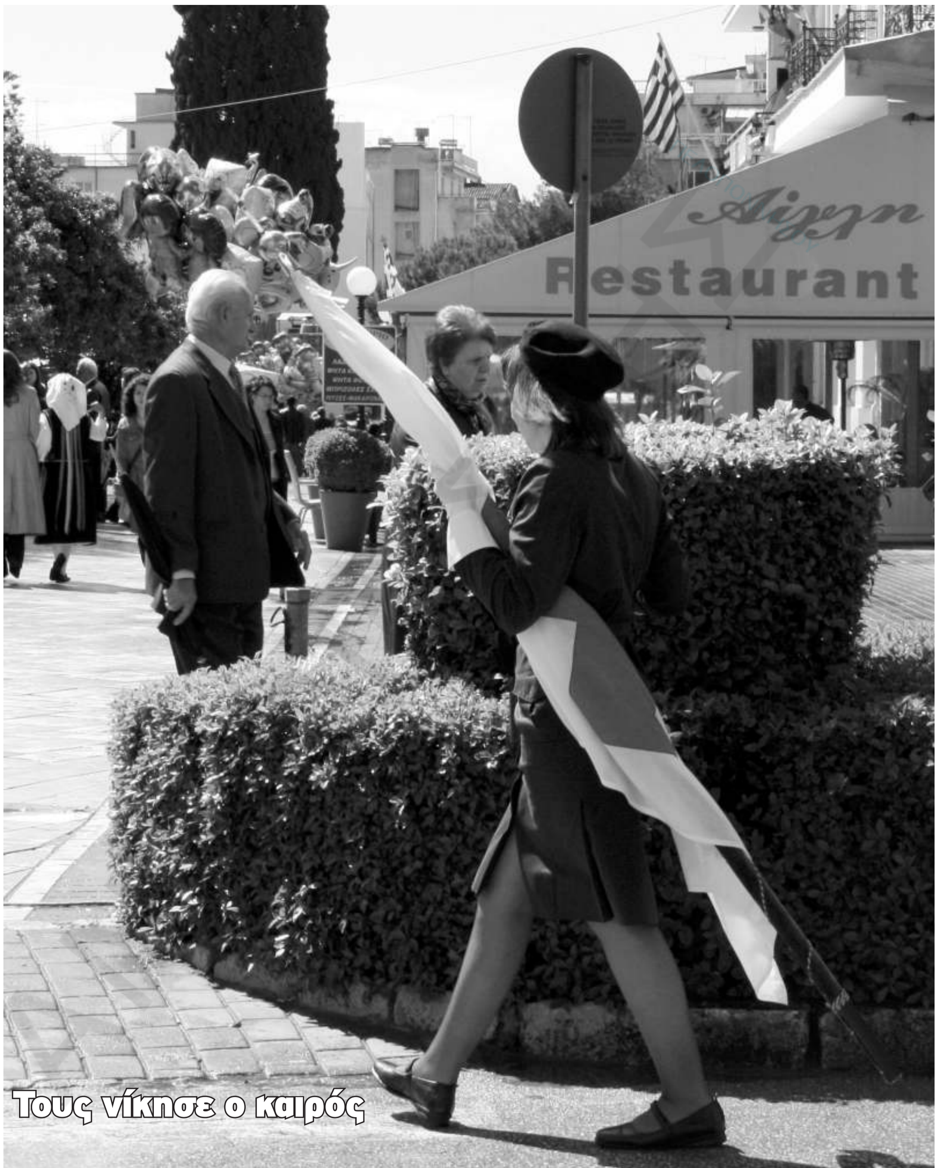
Τους νίκησε ο καιρός