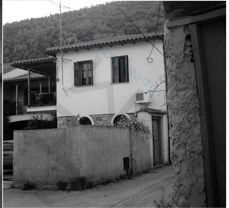
Πίσω από τον Άη Γιάννη, σύμφωνα με την παράδοση της γειτονιάς λειτούργησαν επί Τουρκοκρατίας δύο ιδιωτικά σχολεία Αλληλοδιδασκικής, Αρρένων και Θηλαίων αντίστοιχα, τα χαρακτηριστικά των οποίων ταυτίζονται με τα κτήρια των φωτογραφιών μας (σ.σ. του "α")