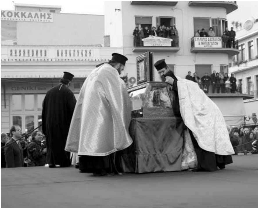
Ιερείς προσκυνούν τα λείψανα του Αγίου