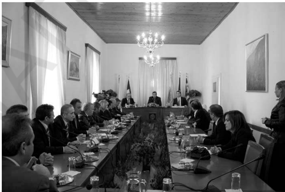
Λίγο πριν την άφιξη των λειψάνων συνεδρίασε το δημοτικό συμβούλιο Άργους αποφασίζοντας μεταξύ άλλων να διατεθεί ένα χρηματικό ποσό για την έρευνα της βιογραφίας του Αγίου Πέτρου του Άργείου.