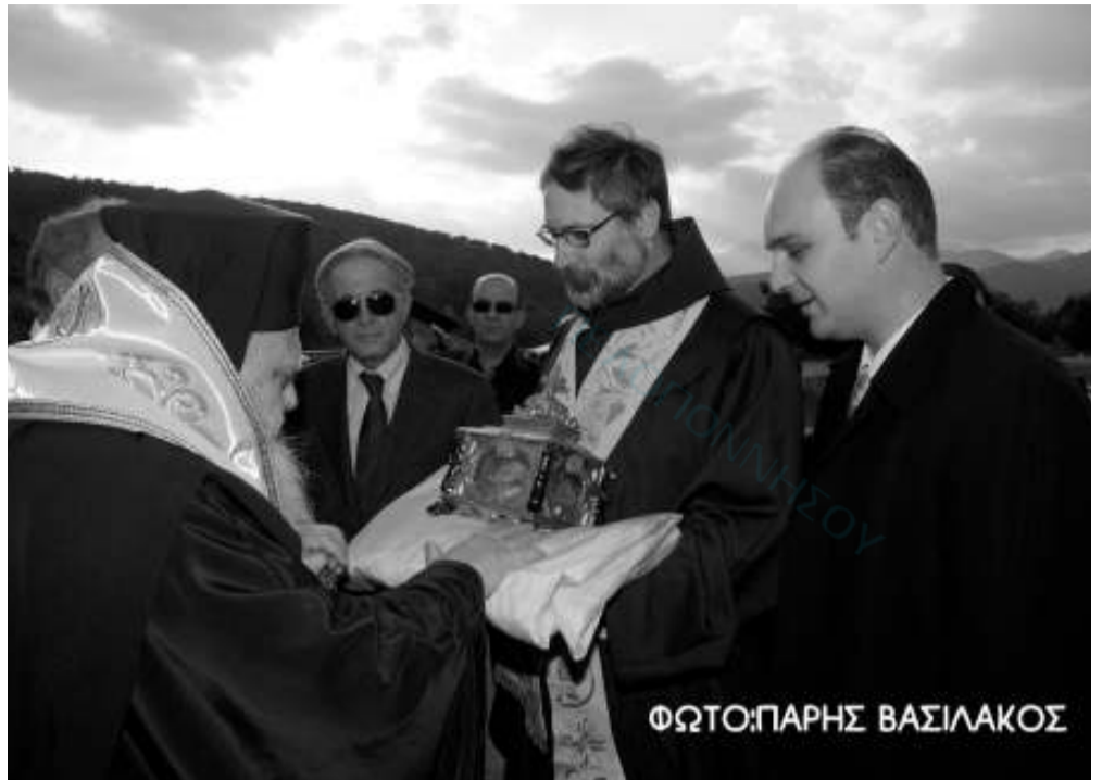
Στον κόμβο της Στέρνας ο Μητροπολίτης Αργολίδας υποδέχεται τα λείψανα του Αγίου