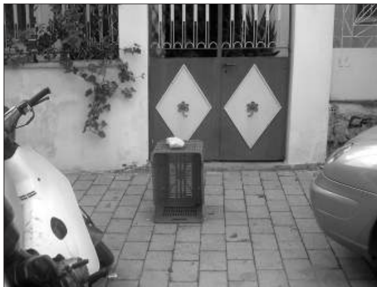
Φορωνέος : με αγκωνάρια πάνω στα τελάρα προσπαθούν να αποτρέψουν τους οδηγούς που θα θελήσουν να παρκάρουν στο παράνομα κατεχόμενο κομμάτι του δρόμου.