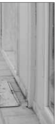
ση πάρκινγκ με τάτα.