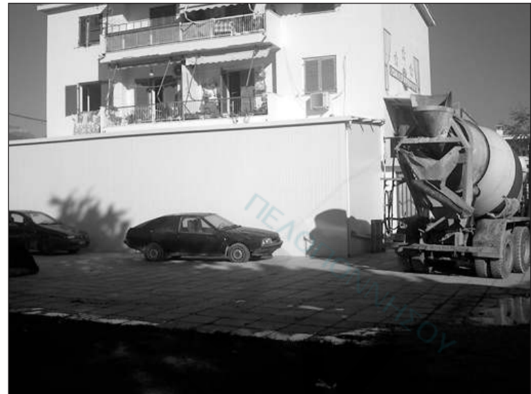
Παλιές Εργατικές Κατοικίες : άμα δεν σου φτάνει ο δρόμος για να επεκτείνεις το μπακάλικό σου καταλαμβάνεις με το έτσι θέλω και κομμάτι της κοινόχρηστης πλατείας.

ου και των ΙΧ επέβαλε τους νόμους της στο Άργος