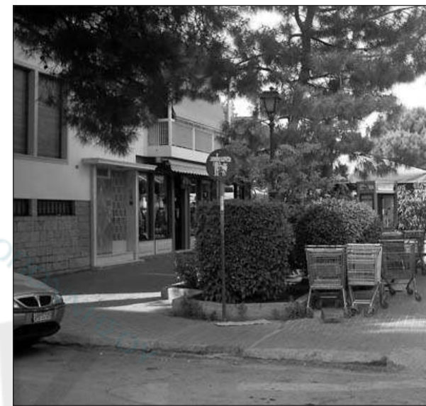
Πεζόδρομος : το περίπτερο δεν μεταφέρθηκε ποτέ σ' αυτό το μέρος γιατί πιθανόν ενοχλούσε το πάρκινγκ των καρτοκάρων.