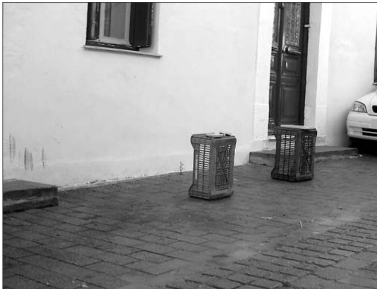
Δαγρέ: η μητέρα μου μου είπε πως μπορώ να παρκάρω εδώ, υπο- στήριξε αλλοδαπή ιδιοκτήτρια, ενώ ο σύζυγός της μας τόνισε με αυστηρό ύφος «γιατί μας χαλάτε τη βραδιά κύριοι;»