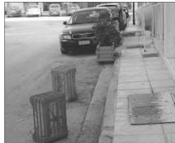
Σε όλους τους δρόμους του Άργους η κατοχύρωση με τελάρα αποτελεί ασθένεια που εκδηλώνεται ταχύτερα