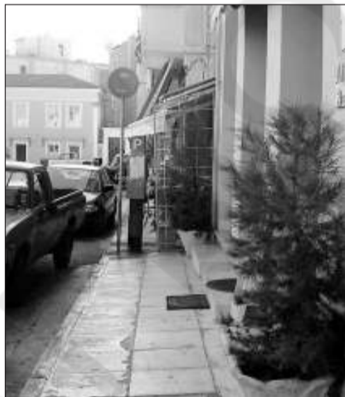
Μπελίνου: α) με πρό- σχημα τον αέρα έφρα- ξαν ένα ακό- μη σημείο του πεζο- δρομίου, όταν η ανοχή γίνεται συ- νενοχή!

Μήπως η πολυχρησιμότητα του τελάρου στο Άργος θα πρέπει να καταγράφει στο βιβλίο Γκί- νες ή ως κοινωνική ανισότητα; Δεν γνωρίζουμε πως η χρήση του τελάρου είναι πατενταρισμένη, αλλά σαφώς θα πρέπει οι τοπικές αρχές να φρο- ντίσουν να «αποτελαροποιήσουν» τη ζωή του Άργους πριν αυτή πατενταριστεί και για άλλες πόλεις.