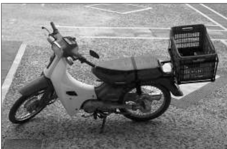
Παραδοσιακή χρήση του τελάρου ως «πορτ μπαγκάζ».

Ήδη και η Τροχαία του Άργους έχει ενημε-