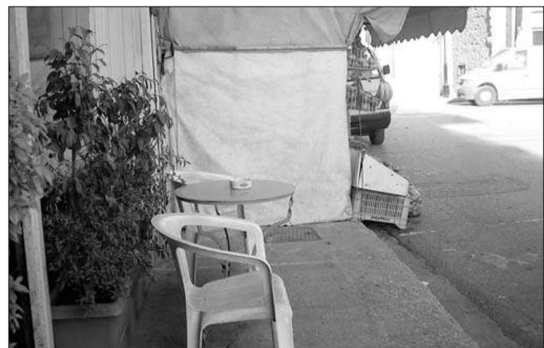
Μπελίνου β): το πεζοδρόμιο της Μπελίνου φαίνεται πως έχει παρα- χωρηθεί προς χρήση των καταστηματαρχών και όταν δεν αρκεί αυτό καταπατούν το κομμάτι του δρόμου