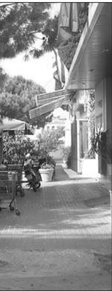
τέ σε αυτό το ση- ροτσιών.