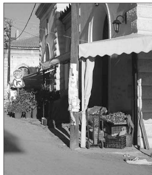
Νεοκλασική Αγορά: σε τσαντίρ μαχαλά έχει μετατραπεί η νεοκλασική αγορά του Άργους, έργο Τσίλλερ και κατα- σκευασμένη από τον Αργείο Νικό- λαο Θεωνά. Περί πεζοδρομίου ούτε λόγος να γίνεται. Όσο δεν κατάπτε η άσφαλτος το εξαφά- νισαν τα καταστή- ματα.