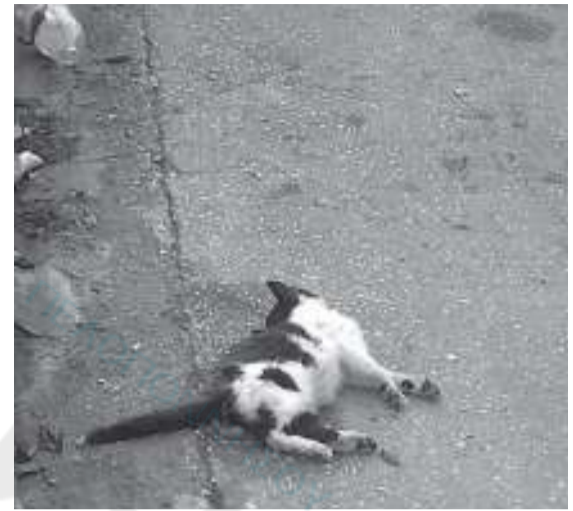
φωτό: Εργατικές κατοικίες Ναυπλίου