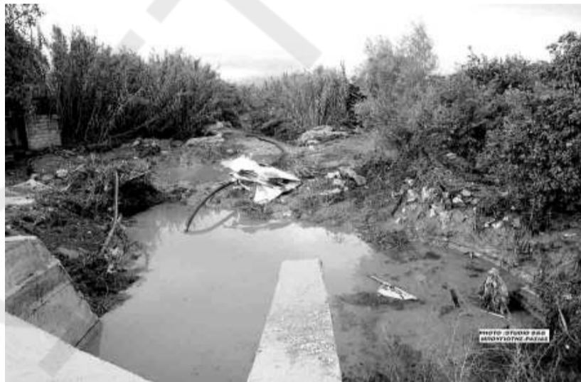
Η λάσπη έπνιξε το Αργολικό και τις καλλιέργειες

Σώθηκε όμως χάρη στην έγκαιρη επέμβαση της Πυροσβεστικής και ενός σκαπτικού μηχανήματος.