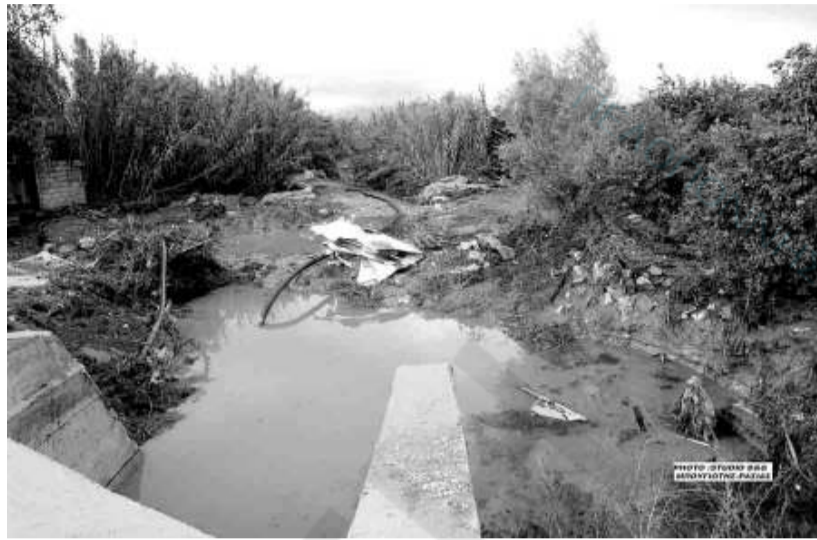
Η γέφυρα στα Σπανέικα που κατασκευάστηκε για να περάσει ο αρχαιολογικός δρόμος, είναι μικρή, καταγγέλλουν οι κάτοικοι

Ιδιαίτερα στο Αργολικό, τα προβλήματα που δημιουργήθηκαν ήταν μεγάλα αφού γέμισαν λάσπη οι αυλές των σπιτιών και κάποια υπόγεια, ενώ πλημμύρισαν και καλλιέργειες. Μέχρι και την επόμενη ημέρα συνεργεία της Νομαρχίας και της Πυροσβεστικής κατέβαλαν προσπάθειες να καθαρίσουν από τις λάσπες τους δρόμους των χωριών. Μια οικογένεια τσιγγάνων με τέσσερα παιδιά μεταξύ των οποίων και ένα μωρό, κινδύνεψε να πνιγεί. Περνούσαν με το αυτοκίνητό τους στους δρόμους του Αργολικού που είχαν μετατραπεί σε ποτάμια, όταν το αυτοκίνητο έοβησε. Ευτυχώς κατέβηκαν και πρόλαβαν να μισούν σε ένα σπίτι. Μία ηλικιωμένη γυναίκα επίσης κινδύνεψε.