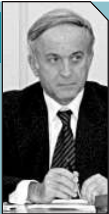
Νομάρχης κατά Μακρή