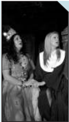
Μήδεια στο Άργος