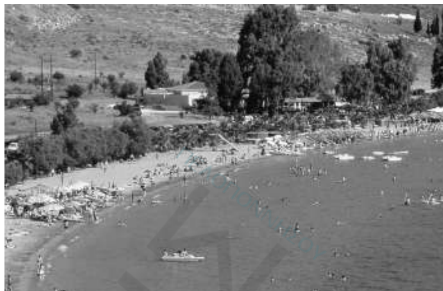
Η δημοφιλής παραλία περνάει στα χέρια ιδιωτών

Χρηματοοικονομικός σύμβουλος αποφασίζει για την τύχη της δημοφιλούς παραλίας του Ναυπλίου