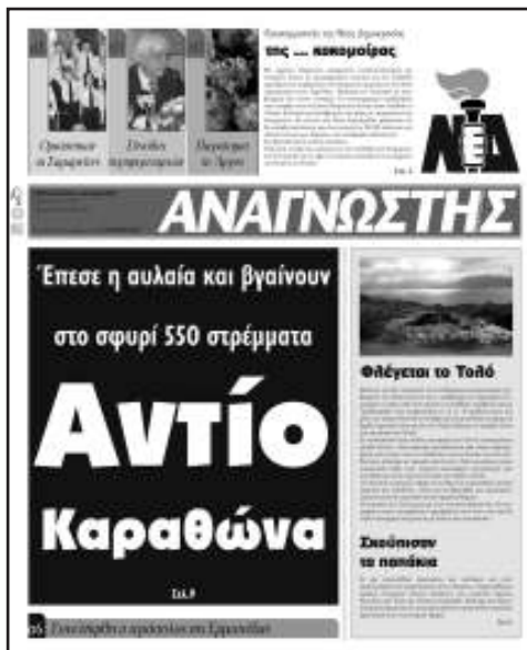
Από τις 17 Μαΐου φωνάζει «Αναγνώστης» και όλοι κοιμούνται