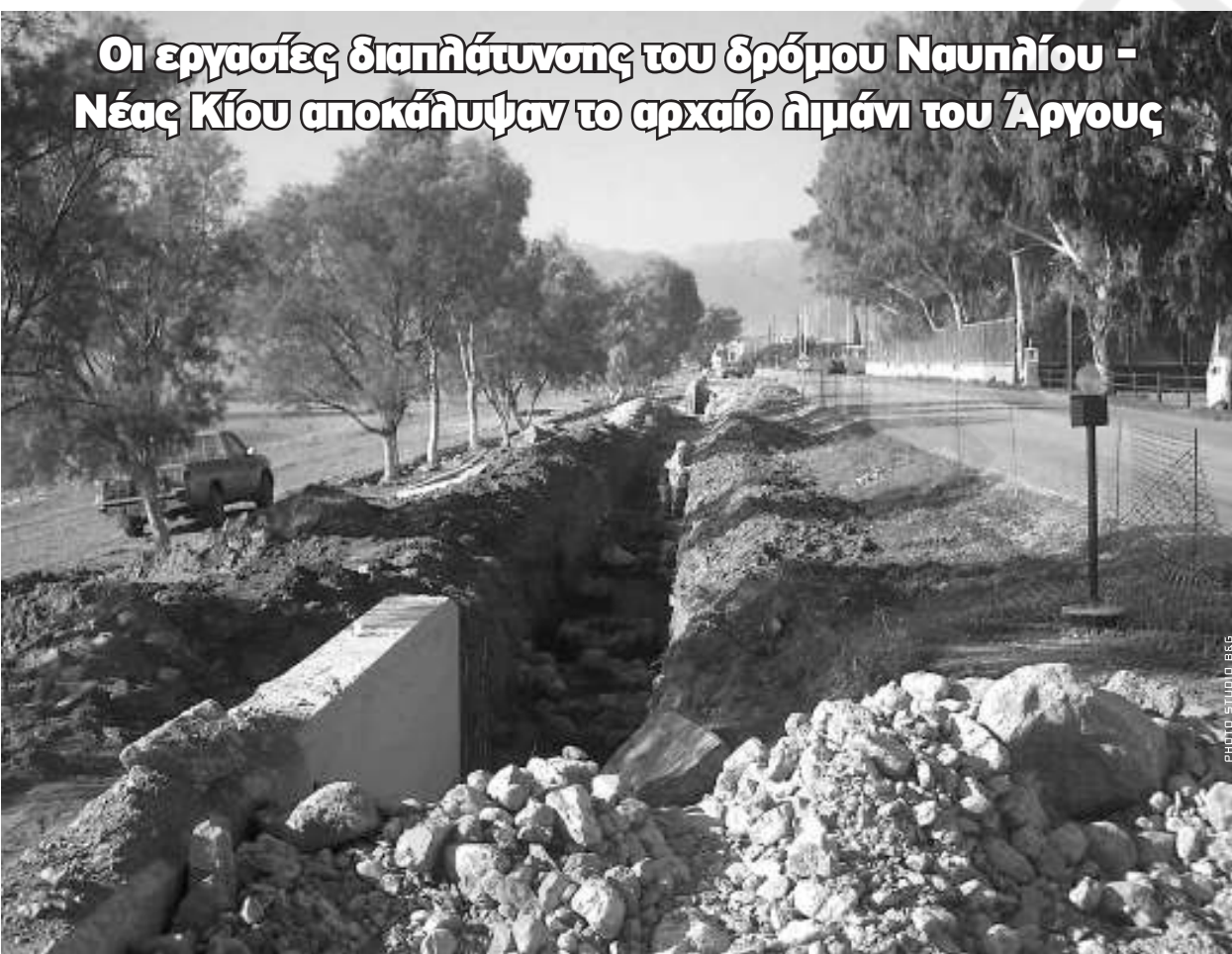
Οι εργασίες διαπλάτυνσης του δρόμου Ναυπλίου - Νέας Κίου αποκάλυψαν το αρχαίο λιμάνι του Άργους

Με μαστίγιο και αφαίρεση διαβατηρίων, δημιουργούν εργασιακό Μεσαίωνα Φάμπρικα σκλάβων