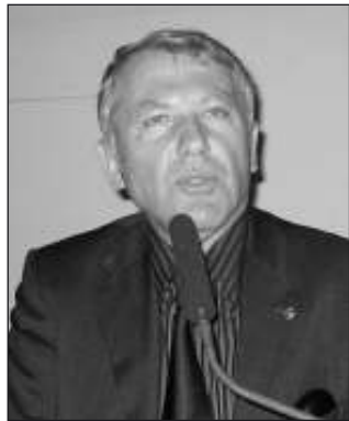
Από τον πρόεδρο της Δημοκρατίας Κároλο Παπούλια, βραβεύτηκε ο επίτιμος δημότης του Ναυ-

πλίου Δημήτρης Νανόπουλος, για το επιστημονικό του έργο. Τα διεθνή βραβεία δόθηκαν από το Κοινωφελές Ίδρυμα Αλεξάνδρος Ωνάσης, στο Μέγαρο Μουσικής. Επίσης βραβεύτηκε και το Κέντρο Ελληνικών Σπουδών του Πανεπιστημίου του Harvard, παράρτημα του οποίου λειτουργεί στο Ναύπλιο.