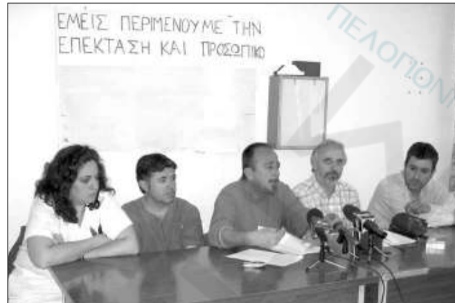
Για μια ακόμη φορά διαμαρτύρονται οι εργαζόμενοι