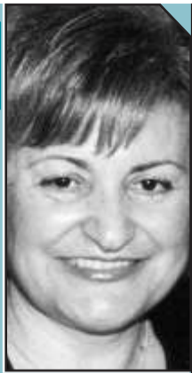
Επέστρεψαν οι μαθητές