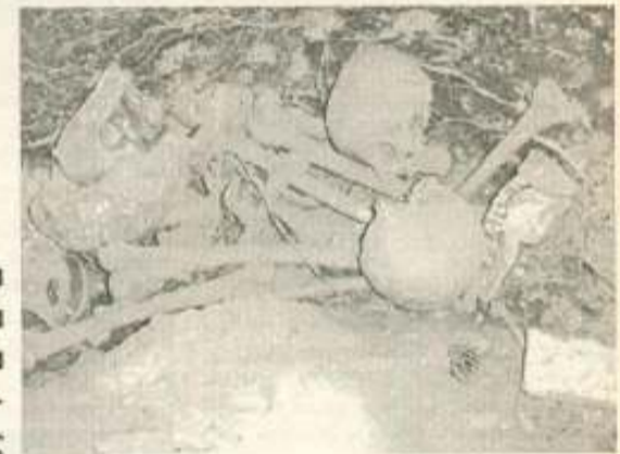
Πέταξαν στα σκουπίδια τα οστά συγχωριανών τους

Όσο για το πραγματικό ενδιαφέρον του εφημέριου και των υπολοίπων καταστροφέντων των μνημείων για την προστασία τόσο του μνημείου όσο και της μνήμης των νεκρών του Παλαιού Κοιμητηρίου, η φωτογραφία με τα νεότερα οστά πεταμένα μαζί με σκουπίδια μέσα σε έναν Μυκηναϊκό Τάφο, μιλά από μόνη της.