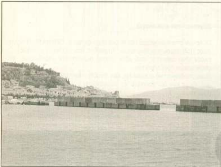
Φεύγουν τα φορτηγά πλοία από το κέντρο του λιμανιού του Ναυπλίου

Το μόνο που θα πρέπει ακόμα να γίνει είναι η εκβάθυνση της εισόδου του Λιμένος μεταξύ του Φάρου και της νησίδας Μπούρτζι. Αν και το βάθος του Λιμένος ανέρχεται στα 8 μ., στο σημείο εκείνο είναι αρκετά ρηχά, ώστε τα μεγάλα κρουαζιερόπλοια να μην μπορούν να μουν και να δέσουν στο λιμάνι. Και προς αυτή την κατεύθυνση, την εκβάθυνση του σημείου εισόδου, είχε στρέψει το ενδιαφέρον του ο Δήμος αναζητώντας πηγές χρηματοδότησης είτε από ευρωπαϊκούς είτε από εθνικούς πόρους. Αν η διάνοση της μούκας δεν ολοκληρωθεί τότε θα συνεχιστεί η ταλαιπωρία των επισκεπτών με τα μεγάλα κρουαζιερόπλοια τα οποία θα αναγκάζονται κάθε φορά να χρησιμοποιούν λέμβους για την αποβίβαση των τουριστών στο λιμάνι της ιστορικής πόλης.