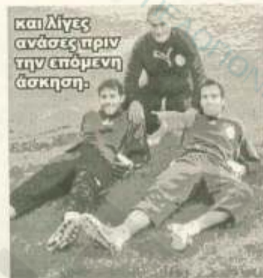
και λίγες ανάσες πριν την επόμενη άσκηση.

Παναργειακού Δημήτρη Καρυάμη «εγώ και οι συνεργάτες