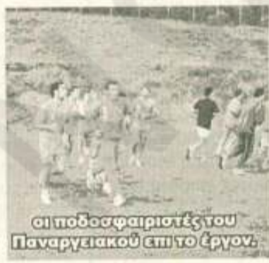
Οι ποδοσφαιριστές του Παναργειακού επί το έργον.

όσο το δυνατόν καλύτερα για το πρωτάθλημα το οποίο αναμένεται να ξεκινήσει στα μέσα Σεπτεμβρίου. Το κλίμα στην ομάδα είναι ευχάριστο παρά το κοπιαστικό πρόγραμμα δείγμα ότι όλοι στην ομάδα είναι αποφασισμένοι να κάνουν τους «Λύκους» να δαγκωνουν και πάλι. Στο ίδιο κέντρο που προετοιμάζεται ο