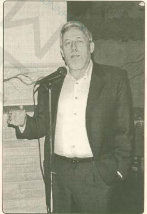
Η ΣΥΝΕΝΤΕΥΞΗ: σελ. 6

Ο βουλευτής εξομολογείται στον «α», για την διαφθορά, τις δωροδοκίες, τις τηλεοπτικές του εμφανίσεις, την επιθυμία του να υπουργοποιηθεί και απαντά στον Ρέππα που τον αποκάλεσε «νούμερο».