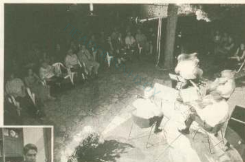
κοπές της με το Φεστιβάλ Ναυπλίου. Το Φεστιβάλ θα