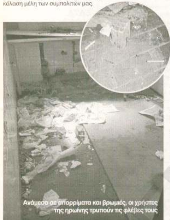
Ανάμεσα σε απορρίματα και βρωμιές, οι χρήστες της ηρωίνης τρυπούν τις φλέβες τους