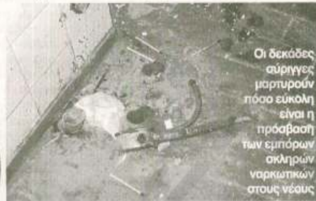
Οι δεκάδες σύριγγες μαρτυρούν πόσο εύκολη είναι η πρόσβαση των εμπόρων σκληρών ναρκωτικών στους νέους

Να σημειωθεί ότι το συγκεκριμένο κτίριο έχει εγκαταλειφθεί,