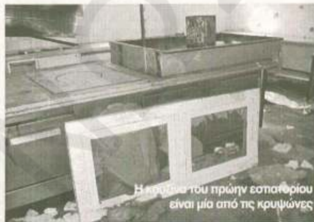
Η κρούνα του πρώην εστιατορίου είναι μία από τις κρυμμένες

αφού ανήκει στον ΕΟΤ, ο οποίος δεν το έχει παραχωρήσει στο δήμο, ενώ παράλληλα στερείται οικοδομικής άδειας. Την Τρίτη έγινε μια ευρεία σύσκεψη στη νομαρχία για τη χερσαία ζώνη της Αρβανιτιάς, όμως οι φορείς που συμμετείχαν φαίνεται ότι αγνοούσαν το συγκεκριμένο ζήτημα.