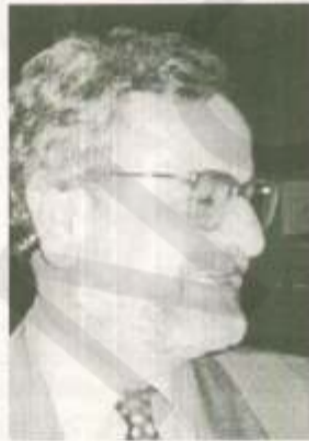
Είσαι Ναυπιώτης ...

Επισημαίνει ακόμα κ. Μαντάς: «Η προσωπική, η εντιμότητα, η ηθική, η κοινωνική, επαγγελματική και οικογενειακή καταξίωση όλων όσων ασχολούνται με τα κοινά κρίνονται καθημερινά και σε όλη τη