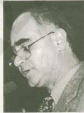
Είσαι Αθηναίος ...

διάρκεια του βίου τους, από το λαό της Αργολίδας και όχι μόνον. Έχουμε κριθεί και κρινόμεθα συνεχώς και σε καμία περίπτωση δεν περιμέναμε την αναγνώριση από πολιτικούς αντιπάλους, από τους οποίους ουδέποτε ζητήσαμε με περίοδο χάριτος». Τέλος, επισημαίνει ο δήμαρχος ότι ο προϋπολογισμός του 2005, είναι ο καλύτερος που έχει κατατεθεί μέχρι σήμερα στο δήμο Επίδουρου, τονίζοντας «είναι στη διάθεση να τον κρίνουν όσοι γνωρίζουν πράγματι από προϋπολογισμούς και όχι οι άσχετοι ερασιτέχνες».