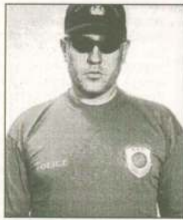
Ιάκωβος: ευτυχώς δεν γνώρισα τον Βαβύλη

μην γίνει ποτέ ουσιαστική κάθαρση με σοβαρές συνέπειες για την αξιοπιστία του κλήρου. Επανειλημμένα με κηρύγματα τους, το σύνολο των κληρικών του νομού που έχει ζητήσει εδώ και καιρό την κάθαρση, βλέπει με αγωνία την Διαρκή Ιερά Σύνοδο να μην τολμά να βάλει το μαχαίρι στην πληγή και για «να ρίξει στην πυρά τους ξένους κλώνους της αμπέλου».