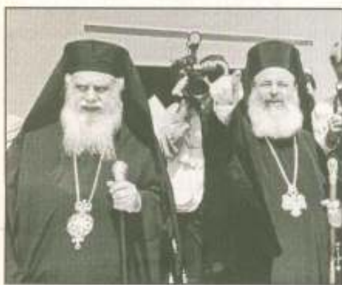
Ο μητροπολίτης Αργολίδας με τον Αρχιεπίσκοπο στη Νομαρχία

Κατά τη διάρκεια της τακτικής ομιλίας του προς τους ιερείς του νομού, ο μητροπολίτης Αργολίδας, αναφερόμενος μεταξύ άλλων στο σκάνδαλο που ταρασσει τους ιερατικούς κύκλους φέρεται να είπε ότι «όταν προ καιρού σκεπτόμουν