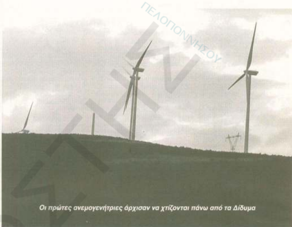
Οι πρώτες ανεμογεννήτριες άρχισαν να χτίζονται πάνω από τα Δίδυμα

Καταγεγραμμένες αντιδράσεις από κατοίκους της περιοχής δεν υπάρχουν. Κατά καιρούς έχουν εκφραστεί φόβοι από διάφορους πολίτες κατά πόσον προσβάλλεται η αισθητική του χώρου με τις τεράστιες ανεμογεννήτριες