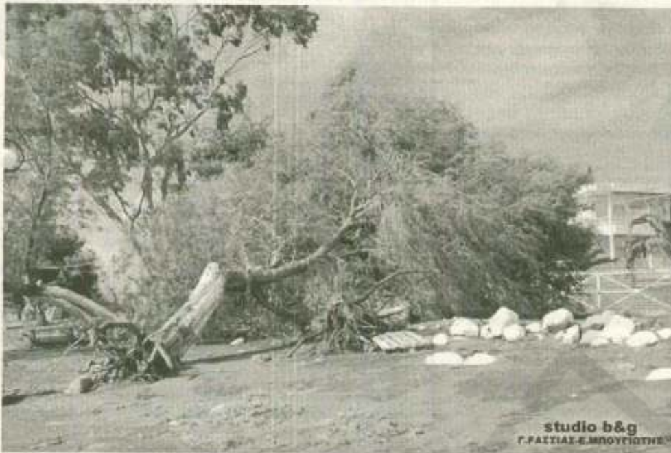
studio b&g Γ. ΠΑΤΙΑΣ-Ε. ΜΡΟΥΤΣΙΩΤΗΣ

Αρκετοί από τους κατοίκους παρομοίωσαν τα