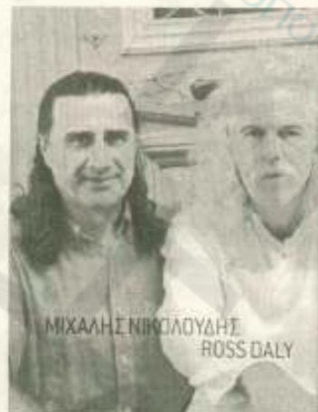
ΜΙΧΑΛΗΣ ΝΙΚΟΛΟΥΔΗΣ ROSS DALY

Από τις 28 Ιανουαρίου άλλαξε γειτονιά και "κουρδίζεται" πιο δυνατά, στον καινούριο του χώρο, στην οδό Δαναού 13, στη στοά. Μετά τις δύο συναυλίες του Βασίλη Λέκκα, ακολουθεί ένα τριήμερο γεμάτο μουσική, που θα συνοδεύεται με μία ιδιαίτερη έκθεση!