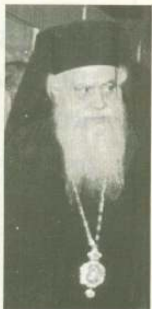
Του Μητροπολίτη Αργολίδας ακώβου Β'

Ως εκ τούτου αδελφοί μου , ας ψάλλωμεν και εμείς σήμερον τον ωραίον Χριστουγεννιά- τικον ύμνον, «Χριστός γεννάται δοξάσατε, Χρι- στός επί γης υψώθητε» και ας συμβάλλωμεν κι εμείς με την ζωήν μας εις ό,τι λέγει ο ανωτέρω Άγιος Γρηγόριος «Μετά του Αστέρους δράμε, και μετά Μάγων δωροφόρησον χρυσόν και λίβα- νον και σμύρναν, μετά Ποιμένων δόξασσον, μετά Αγγέλων ύμνησον, μετά Αρχαγγέλων κόρευ- σον, έστω κοινή πανήγυρις ουρανίων και επι- γείων Δυνάμεων» (Λοκ. λη Γρ. Θεολόγου).