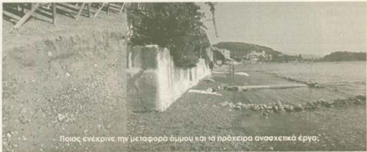
Ποιος ενέκρινε την μεταφορά άμμου και τα πρόσκαιρα ανασχετικά έργα;