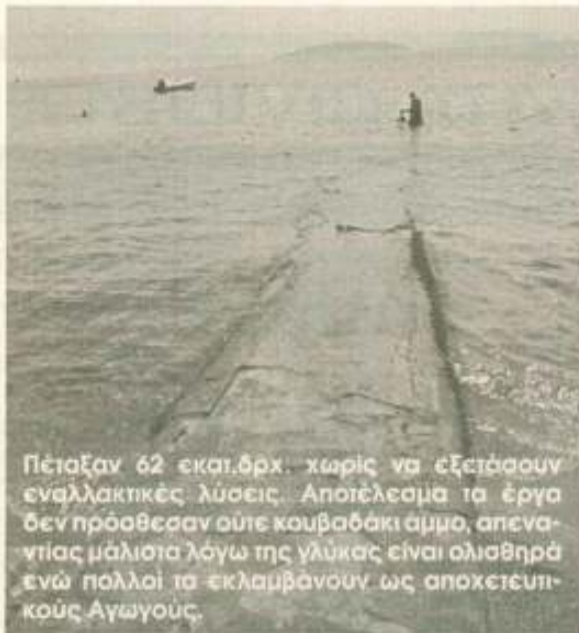
Πέταξαν 62 εκατ.δρχ. χωρίς να εξετάσουν εναλλακτικές λύσεις. Αποτέλεσμα το έργο δεν πρόσθεσαν ούτε κουβαδάκι άμμο, απεναντίας μάλιστα λόγω της γλύκας είναι ολισθηρά ενώ πολλοί τα εκλαμβάνουν ως αποχετευτικούς Αγωγούς.