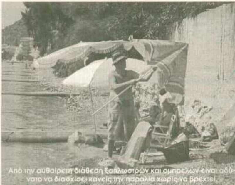
Από την αυθαίρετη διάθεση ξαπλωστών και ομπρελών είναι αδύνατο να διασχίσει κανείς την παραλία χωρίς να βρέξει.