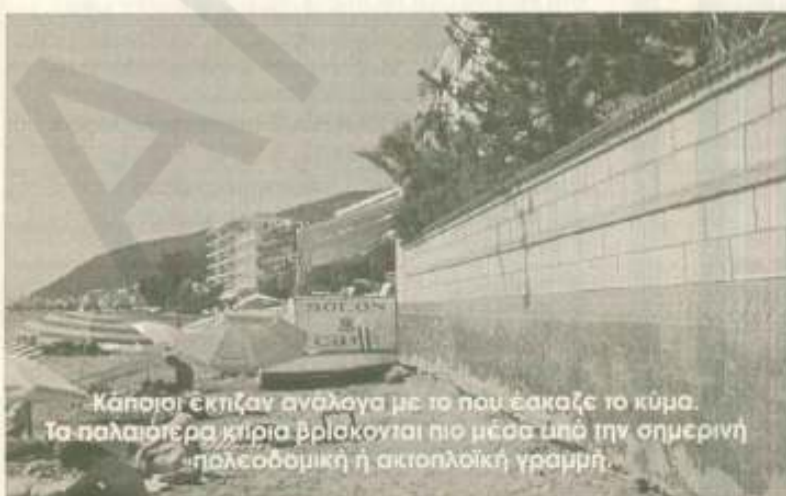
Κάποιοι εκτίζαν ανάλογα με το που έκαζε το κύμα. Τα παλαιότερα κτίρια βρίσκονται πιο μέσα υπό την σημερινή «πολεοδομική ή ακτοπολική γραμμή».

Το Τολό προσέφερε πολλά στον Τουρισμό της Αργολίδας, πολλά περισσότερα ακόμα και από το Ναύπλιο, τώρα όμως χρειάζεται επειγόντως την βοήθεια της Πολιτείας και των Υπηρεσιών της, όντα αυτές ξυπνήσουν απ'την εθελουσία νάρκη τους.