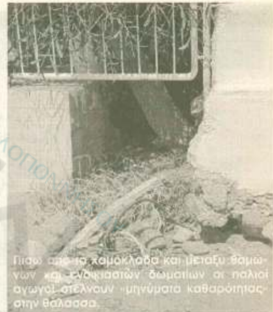
Πίσω από το χαμόκλωρο και μεταξύ θομωτών και ενδοκίσιων δωματίων οι παλιοί αγωγοί στέλνουν «μηνύματα καθαρότητας στην θάλασσα».