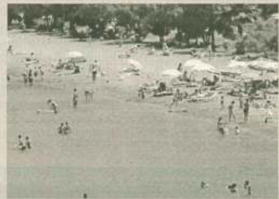
παρέμβαση Λούμου για την Καραθώνα σελ. 4

Μαζί με τους πολίτες, μέσα στην κοινωνία η Ν.Δ. εκπληρώνει στο ακέραιο την αποστολή της. Εκπροσωπούμε και εκφράσουμε όλες τις κοινωνικές ομάδες. Ενισχύουμε το έργο της Κυβέρνησης μας. Όλοι μαζί θα χτίσουμε τη Νέα Ελλάδα, την Ελλάδα της δημιουργίας και της προόδου.