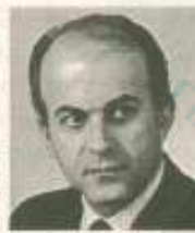
Τους κάλεσε ο Σωτηρόπουλος

Κώστας Καραμανλής και η Κυβέρνηση καταβάλουν υπέρμετρες προσπάθειες και εγγυώνται