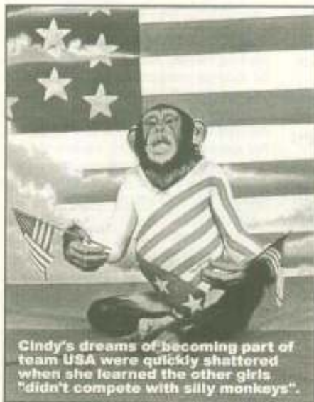
Cindy's dreams of becoming part of team USA were quickly shattered when she learned the other girls "didn't compete with silly monkeys".

γιατί ψηφίζει να σου πω πόσα κιλά αμελέττα θα πάρεις. -Το μπαρμπουνάκι θέλει μπυρίτσα κι ευρωεικλογές θάλασσα. Ρε συ Χασάπη, τι ψηφίσεις; -Καλά που υπήρχε το παιχνίδι με την Εθνική και αισθανθήκαμε όλοι λίγο εθνικά περήφανοι που φτάσαμε σε ευρωπαϊκό επίπεδο να αποκλείουμε ομάδες. Τουλάχιστον μπορεί στο Ευρωκοινοβούλιο να μην ξέρουμε τι παίζεται, όμως το «τόπι» το βαράμε. -Καταπληκτικός αυτός ο Καρτζαφέρης. Αφού πασχίζει τόσο καιρό να μας πείσει ότι βρίσκεται δεξιότερα της Δεξιάς, ξαφνικά ανακαλύπτει ότι υπάρχει και δεξιότερα της δεξιότερης Δεξιάς. Άβυσσος η Δεξιά της Δεξιάς.