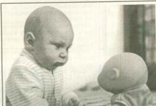
"Святое распятие ! Меня клонировали !!!"