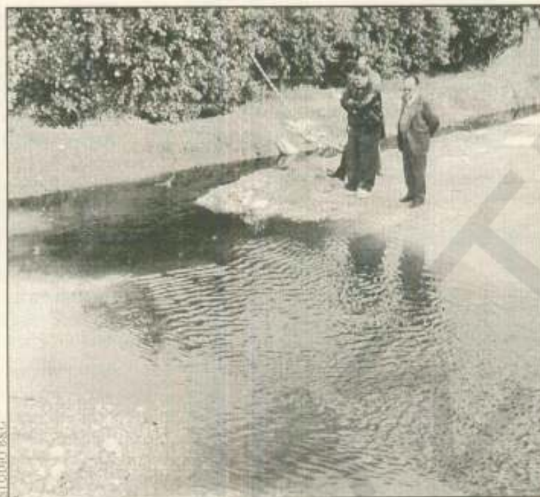
Θα εφαρμοστεί η απόφαση του νομάρχη, ή θα κάνουν τα «στραβά μάτια» οι υπηρεσίες;

Τα ανωτέρω θα ανακληθούν σε περίπτωση που θα προκύψουν νέα νομοθετικά δεδομένα σε ότι αφορά την επεξεργασία των αποβλήτων.