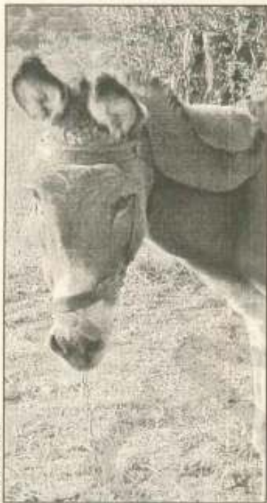
Ψόφησε ο γάιδαρος που έπινε για χρόνια νερό από γεώτρηση στο Παναρήτι

Για να προκληθεί καρκίνος, πρέπει να είναι μακροχρόνια η χρήση αλλά δυστυχώς δεν μπορούμε να πούμε ακριβώς πόσο. Όλοι αυτοί οι βλαπτικοί παράγοντες που προκαλούν καρκίνο και τα νιτρικά μαζί, για να εκδηλώσουν το φαινόμενο της καρκινογένεσης περνάνε πάρα πολλά χρόνια. Γι' αυτό είναι πολύ δύσκολο κανείς να αποδείξει