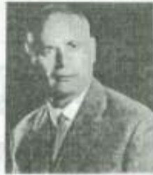
Με ένα καινούργιο βιβλίο υποδέχθηκε τον Σεπτέμβρη ο γνωστός Αρχιεπίσκοπος Βαγγέλης Κλαδούχος.

Η συλλογή ποιημάτων με τίτλο «η αρχοντιά στον στίχο», εκδόθηκε από την «Αναγέννηση» και συμπληρώνει ένα ακόμα βιβλίο στα τόσα του ποιητή, το οποίο αποτελεί μια ιδέα ειρήνης, ομορφιάς της φύσης, του ανθρώπου και προκοπής προόδου.