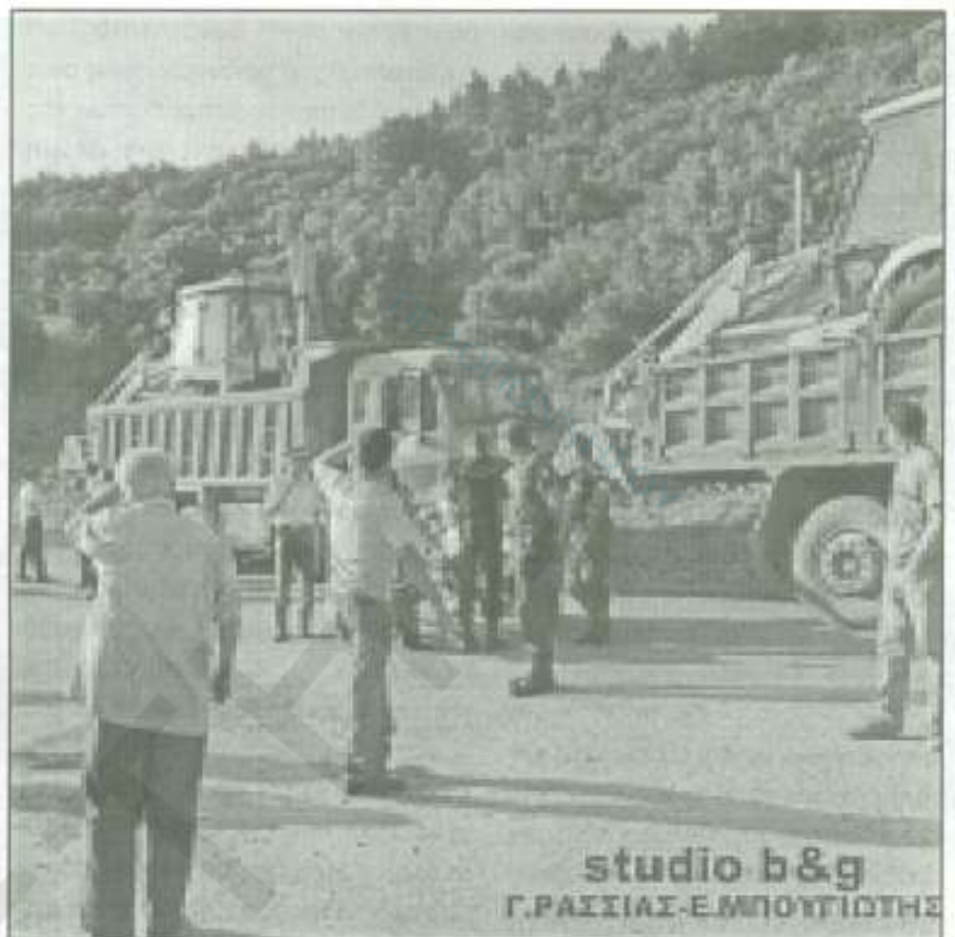
studio b&g Γ.ΡΑΣΣΙΑΣ-ΕΜΠΟΤΙΣΤΗΣ

ΟΤΑΝ ΑΝΑΨΑΝ ΤΑ ΦΩΤΑ, ΣΤΗΝ ΣΚΗΝΗ υπήρχαν μεγάλοι καθρέφτες για φαίνονται τα είδωλα των θεατών, αμχανιοί όσο ποτέ σε αυτό το θέατρο, άλλοι όρθιοι, άλλοι να χαιδεύουν το κινητό τους τηλέφωνο άλλοι να ριχνουν κλεφτές ματιές προς τους καθρέφτες. Μια βουβή αμχανία, μέχρι την στιγμή που γνωστός δικηγόρος αντάλλαξε χειραψία με τον Ντε Γκρέτσια, ένα δυνατό σου, σου ακούστηκε, αυτός φταίει για όλα, ένωσαν τα χέρια γύρω από το στόμα και άρχισαν το λυτρωτικό γιουχάρισμα, ήταν η κατάλληλη ευκαιρία για αν λυτρωθούν από την ενόχη και την αμχανία. Αλλά κανείς δεν ήθελε να δει ότι από τους καθρέφτες της σκηνής το γιουχάρισμα επέστρεφε καθρεφτιζόμενο προς τις κερκίδες.