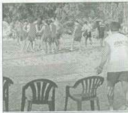
σεχί Κυριακή 15/7/02.

Μεγάλη επιτυχία σημειώνει το 2ο θερινό τουρνουά Μπιτς Σόκερ στην Καραθώνα που ξεκίνησε την περασμένη Κυριακή και ολοκληρώνεται την προ-