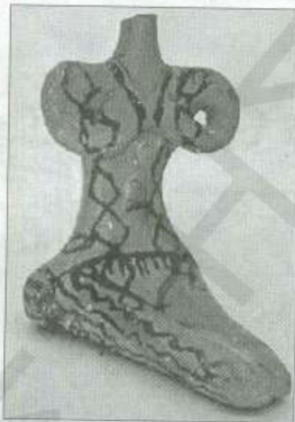
Γυναικείο εδώλιο της Νεολιθικής περιόδου φτιαγμένο από πηλό. Η ζωγραφισμένη διακόσμηση είναι πιθανόν ένδειξη ενδυμασίας. Τα εδώλια πρωτοεμφανίστηκαν στο Φράγχθι κατά τη διάρκεια της Νεολιθικής περιόδου και είναι όλα γυναικεία.