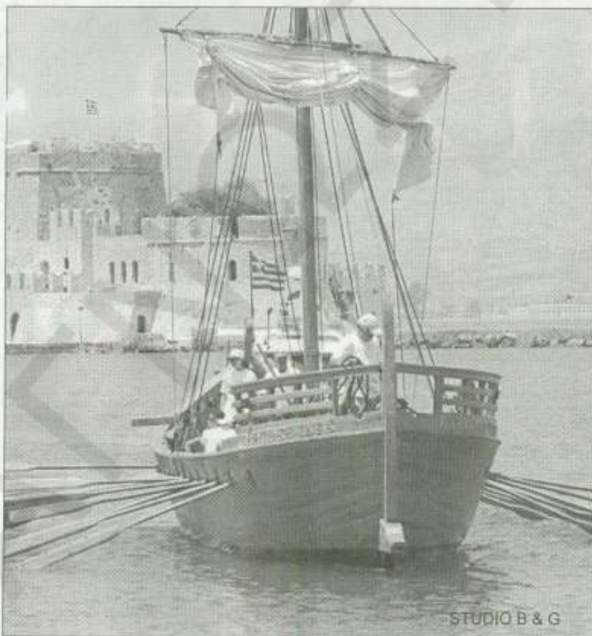
STUDIO B & G

Ιστορικές γραπτές περιγραφές δυστυχώς για την τριακόντορο δεν διασώθηκαν, παρά μόνο λίγες απεικονίσεις σε αγγεία και σε μαρμάρινα ανάγλυφα πράγμα που καθιστά σχεδόν αδύνατη την κατασκευή ομοιώ-