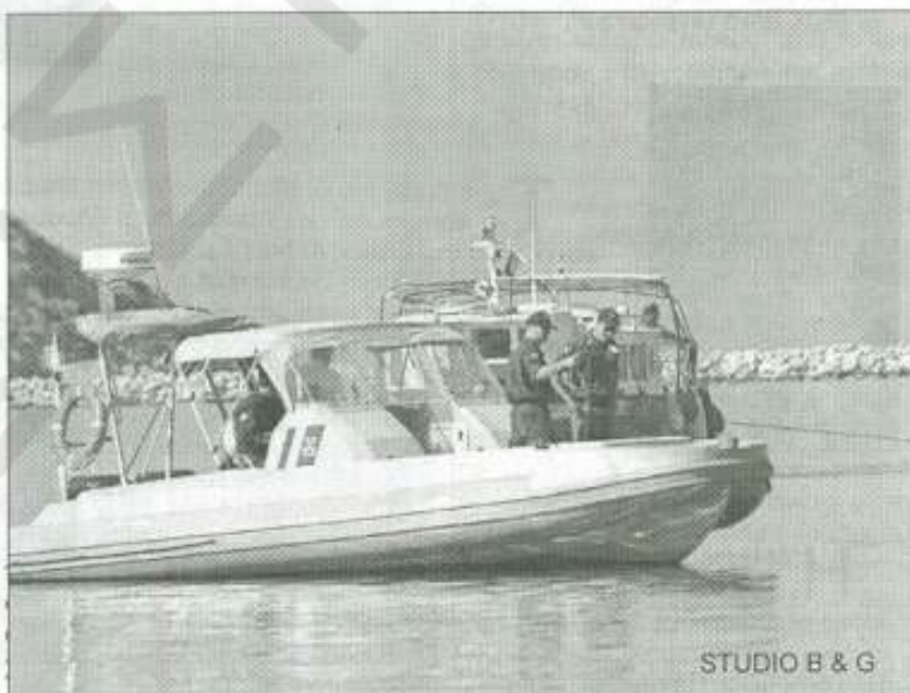
STUDIO B & G