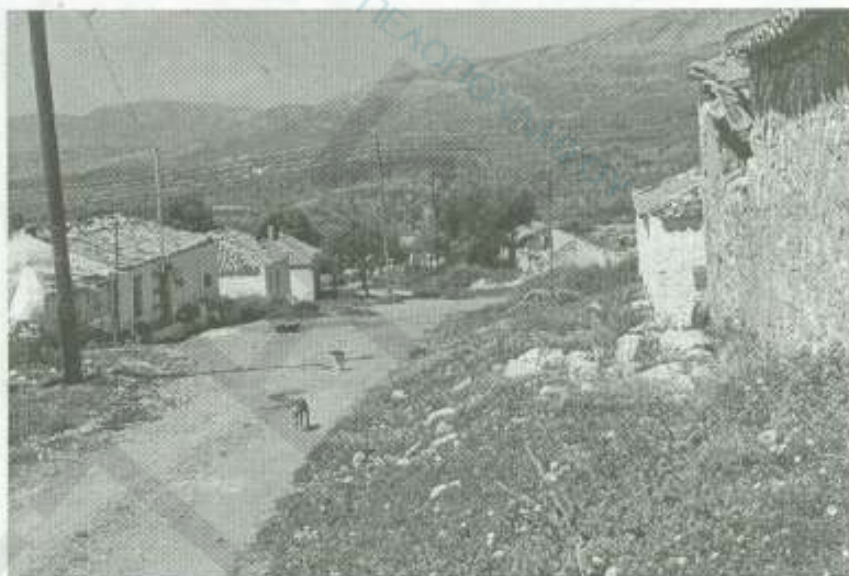
Έρημα χωριά σε Αργολίδα και Κορινθία (ΠΕΛΕΗ)

Όποιος θελήσει να διασχίσει την Αργολίδα και κυρίως την ορεινή θα διαπιστώσει την εγκατάλειψη που κυριαρχεί σ' αυτήν. Σπίτια γκρεμισμένα, άδεια δρόμοι, σχολεία κλειστά, ανύπαρκτη εμπορική δραστηριότητα.