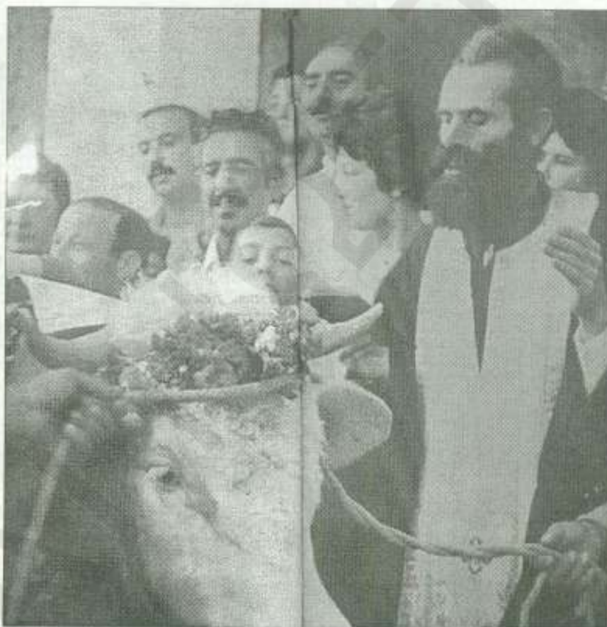
Η ευλογία του ταύρου από τον ιερέα πριν από τη θυσία

Σημαντικό ρόλο στην λαογραφία του Ιουλίου παίζει και ο Σείριος. Το πιο λαμπρό άστρο του μεγάλου Κυνός, συμπίπτει να ανατέλλει τον Ιούλιο μαζί με τον ήλιο. Πολλοί μάλιστα ερευνητές ταυτίζουν ορισμένες θυσίες σκύλων (κυνοφώνια) στην αρχαιότητα με τον Σείριο, ο οποίος ήταν ένας από τους δυο σκύλους του κυνηγού Ωρίωνα. Ο Σείριος χαρακτηρίζεται σπιρινός επειδή βγαίνουν και σπώρες αλλά και ολέθριος επειδή αρχίζουν οι καύσωνες, ίσως για τον δεύτερο αυτό λόγο να πραγματοποιούνταν τα κυνοφώνια, ως αποτρεπτικά της ξηρασίας. Ο Σείριος αναφέ-