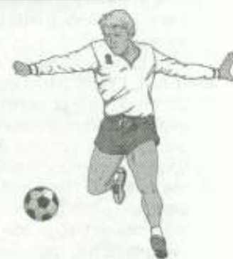
Αετός Κρουονερίου 16β

ΚΥΚΛΟΦΟΡΗΣΕ ΤΟ ΠΡΩΤΟΧΡΟΝΙΑΤΙΚΟ ΚΡΑΤΙΚΟ ΛΑΧΕΙΟ ΚΕΡΔΗ ΠΕΝΤΑΔΑΣ 9.000.000 ΕΥΡΩ (3.066.750.000 ΔΡΧ.) ΧΙΛΙΑΔΕΣ ΑΛΛΟΙ ΤΥΧΕΡΟΙ ΚΛΗΡΩΣΗ ΣΤΙΣ 31 ΔΕΚΕΜΒΡΙΟΥ 2001 ΚΑΙ ΩΡΑ 5 μ.μ.