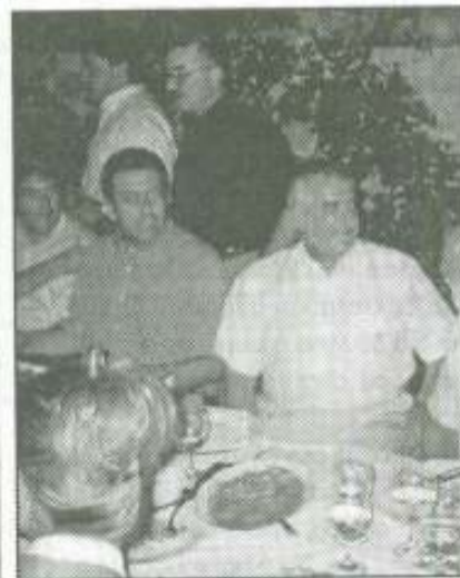
T. Σαλεσιώτης: κάθισαν μαζί

Ο Πρόεδρος του ΚΕΠ πάντως σε δηλώσεις του είπε ότι βρίσκεται στο Τολό με